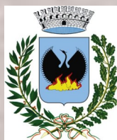
Comune di Ardesio