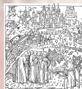
Ordine degli Ingegneri della Provincia di Bergamo