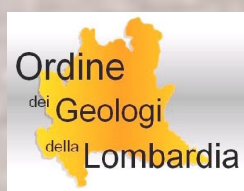
Ordine dei Geologi della Lombardia