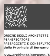
Ordine degli Architetti, Pianificatori, Paesaggisti e Conservatori della Provincia di Bergamo